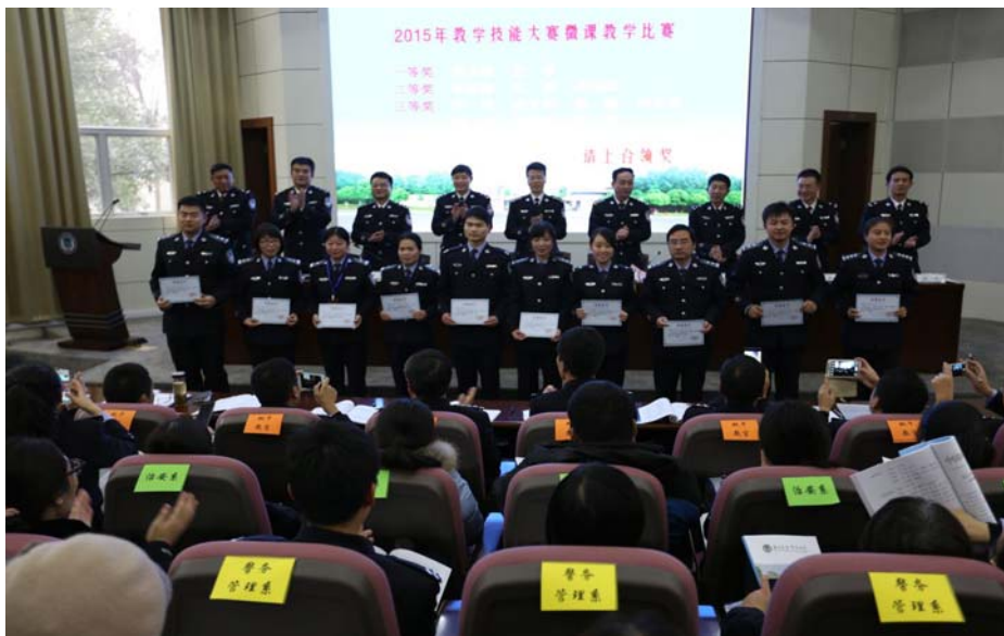
图3 学校为2015年教学技能大赛微课教学比赛中获奖的教师颁奖