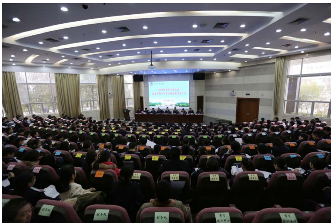
图 2 我校召开 2015 年教学工作会议暨本科教学工作合格评估动员大会

本学年初，学校党委组织专题性的全校教职工大会，针对本科教学工作合格评估工作，以及学士学位授予权评审中发现问题的整改工作进行安排部署，党委书记和校长分别就学校教学工作和教育教学工作存在的问题进行了全面、系统梳理，针对学校内涵发展进行了深入阐述，提出近 2 年学校要继续以“提升质量”为主轴，进一步强力推进学校各项工作。