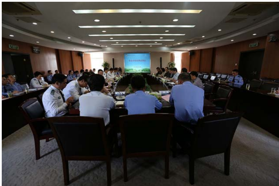
图 6 2016 年 6 月学校召开专业评估反馈会

校内教学专项评估作用突出。认真落实“以评促建、以评促改、以评促管、评建结合、重在建设”的评估方针，常态化开展校内教学评估，2015-2016 学年组织开展了专业评估和毕业论文（设计）评估工作，共有 8 个本科专业和 7 个系作为受评对象参加了评估，有力地促进了专业建设水平和教学管理水平的提高。