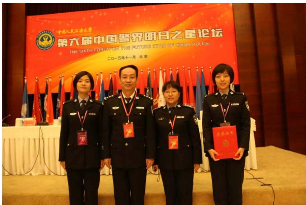
图 5 张高文校长出席“中国警界明日之星论坛”开幕式并为获奖学生颁奖

此外，通过积极组织学生参加重大安保活动，深化学生创新创业意识。本年度，应南京市公安局、省教育考试院、浙江省公安厅等单位邀请，为各类考试、中超或足协等赛事和国家有关重大活动提供安保协勤服务 30 余次，参与 1 万余人次。