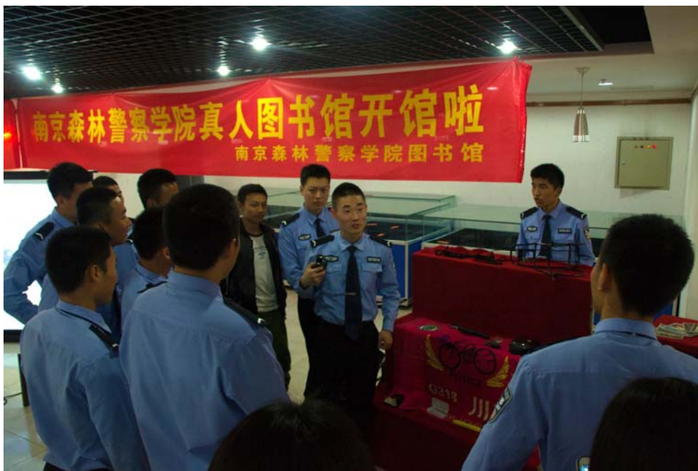
图1 图书馆开办全国警察院校第一家真人图书馆

学校拥有因特网和公安信息网两套网络，覆盖花园路、仙林两校区。全校共安装数据信息点 7,400 个，接入教学用电脑 1,500 多台，在线运行各类网络及路由交换设备 180 台，服务器及存储设备 41 台，铺设各类光纤 50km，互联网出口 10M 专线连接教育科研网，100M 专线连接中国移动骨干网，300M 专线连接中国电信骨干网。2015 年完成了统一身份认证与管理平台、统一信息门户、数据中心及人事管理系统的建设工作。目前，校园网上运行各类网站 36 个，建立了教务管理系统、科研管理系统以及学校教学基本状态数据库等多个应用系统，各项系统得到广泛运用，提高了教学、管理工作质量及效率。