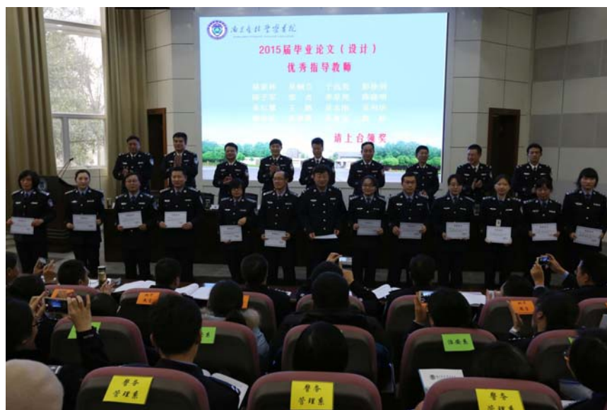
图 4 学校为 2015 届毕业论文（设计）优秀指导老师颁奖

全校本科毕业论文（设计）2015 届共 981 篇，在实验、实习、公安基层实践和社会调查等社会实践中完成的占 91.6%，平均每名教师指导毕业生数 5 人，其中毕业论文（设计）成绩为优秀和良好的占 39.8%。2016 届共 1087 篇，在实验、实习、公安基层实践和社会调查等社会实践中完成的占 92.36%，平均每名教师指导毕业生数 6 人，其中毕业论文（设计）成绩为优秀和良好与上届持平。